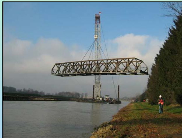
Die alte Birgter Brücke am Haken des größten kanalgängigen Schwimmkranes „Atlas“ während ihres Abbruchs im Januar 2004

Der im Bereich des Dortmund-Ems-Kanals überwiegend eingesetzte Brückentyp ist die Trogbücke. Bei ihr liegt das Tragsystem im Wesentlichen oberhalb der Fahrbahn und schafft damit optimale Voraussetzungen für die hier im Bereich zwischen Dortmund und Bergeshövede erforderliche Durchfahrthöhe unter den Brücken von 5,25 m. Damit können auch die neuen Schiffstypen die Brücken gefahrlos passieren.