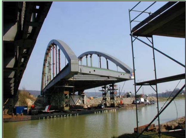
Moment der Lastübernahme durch ein im Kanal liegendes Ponton beim Einschwimmvorgang der Birgter Brücke im April 2003