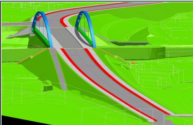
Beispiel für die Darstellung einer dreidimensional am Computer geplanten Brücke

Häufiger Grund für den Ersatz einer Brücke ist zum Beispiel das Erreichen der Lebensdauer des Bauwerkes von ca. 80 Jahren. Darüber hinaus kann es jedoch auch andere Gründe für einen Ersatz geben. Einer davon ist die Vorbereitung für den Kanalausbau. Hier gilt es, zuerst den Raum unter der Brücke in Breite und Höhe - das so genannte Lichtraumprofil - zu vergrößern. Um die Voraussetzung für eine Vergrößerung des Lichtraumprofils zu schaffen, werden die vorhandenen Brückenbauwerke in dem vom Ausbau betroffenen Kanalabschnitt durch neue, längere und höher liegende Brücken ersetzt.