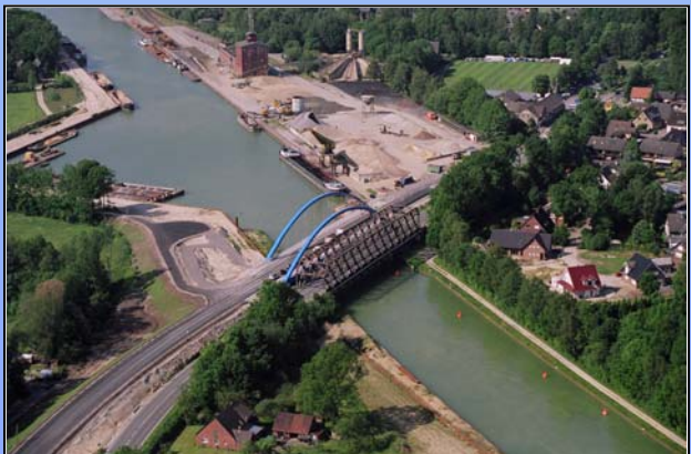
Luftbild der alten und neuen Dörenther Brücke

Die hier im Bereich des Dortmund-Ems-Kanals verwendete Stabbogenkonstruktion als Form der Trogbücke ist eine filigran wirkende, luftige Querung des Kanals, welche problemlos die neuen geforderten Spannweiten zwischen den beiden Kanalufers überbrückt.