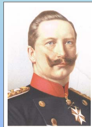
Kaiser Wilhelm II.