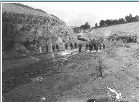
Klippeinschnittstrecke in Riesenbeck

Angesichts der hohen Kosten verlegte sich die Regierung auf die Taktik, den Dortmund-Ems-Kanal als erstes Teilstück ihrer größeren Kanalprojekte bauen zu lassen. Die erste Vorlage von 1882 scheiterte unter der Begründung der einseitigen Bevorteilung des Ruhrreviers. Die erneute Vorlage, gekoppelt mit Flussregulierungen in Schlesien, fand 1886 die Zustimmung des Landtages.